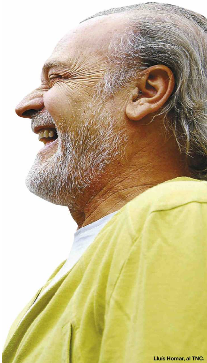
Lluís Homar, al TNC.